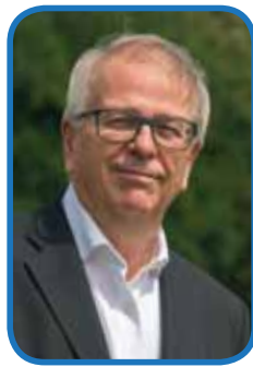
Bernard HILLIET Économie touristique Maire de Quiberon